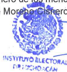
LIC. JUAN JOSÉ MORENO CISNEROS SECRETARIO EJECUTIVO DEL INSTITUTO ELECTORAL DE MICHOACÁN